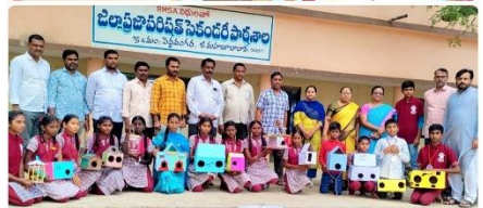
WORLD SPARROW DAY AT ZPHS, PEDAVANGARA IN MAHABUBABAD DISTRICT ON 20 TH MARCH 2024