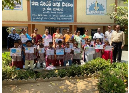
WATER DAY AT ZPHS BHOTPUR, MAHABUBNAGAR DISTRICT