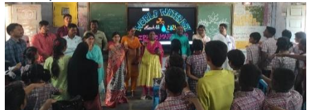
WATER DAY PLEDGE AT ZPHS(BOYS) MAHABUBABAD