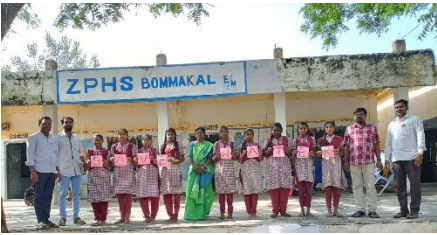
WATER DAY AT ZPHS BOMMAKAL, MAHABUBABAD DISTRICT

“Eat healthily, sleep well, breathe deeply, move harmoniously.”