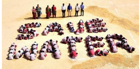
WATER DAY AT ZPHS, JAJAPUR, NARAYANPET DISTRICT