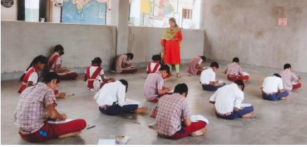
SAVE WATER COMPETITION AT ZPHS, BALURUGONDA, MAHBUBNAGAR DISTRICT