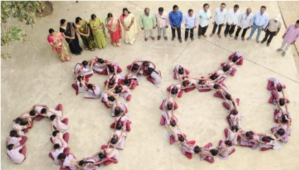
WATER DAY AT ZPHS KAMBALAPALLY IN MAHABUBABAD DISTRICT