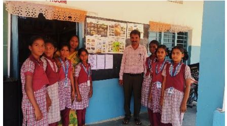
WATER DAT AT ZPHS DANDUMAILARAM, RANGAREDDY DISTRICT