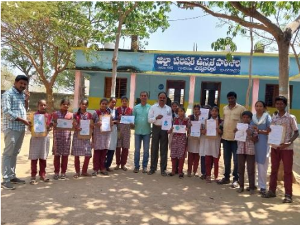
WATER DAY AT CHIINA VARVAL, GANDEED MANDAL, MAHABUBNAGAR DISTRICT