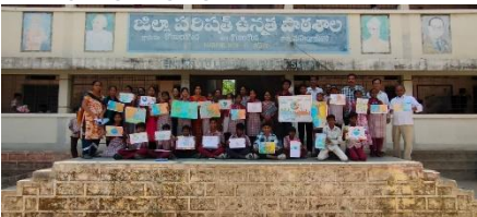
WATER DAY AT ZPHS KOILKONDA, MAHABUBNAGAR DISTRICT