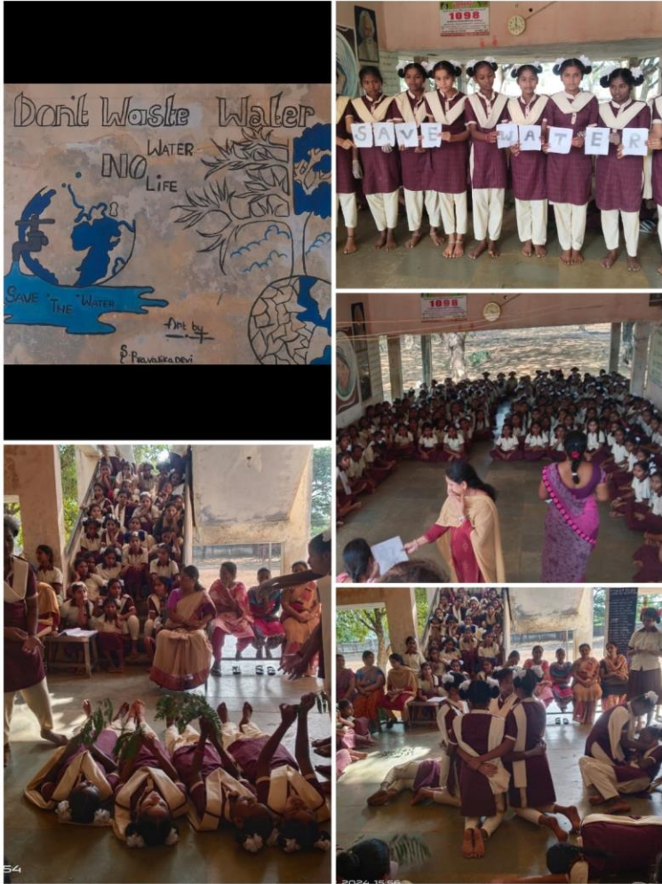
WATER DAY OBSERVED BY VILUVALA BADI SCHOOLS AT KUNDURPI MANDAL, ANANTAPUR DISTRICT ORGANIZED BY SAMAJA KRANTI CHARITABLE TRUST