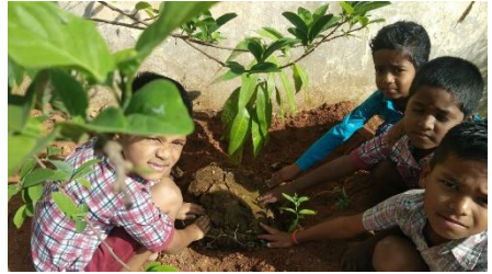
TENDING SCHOOL GARDEN ON FOREST DAY AT UPS SANGHIGUDA, MAHABUBNAGAR DISTRICT