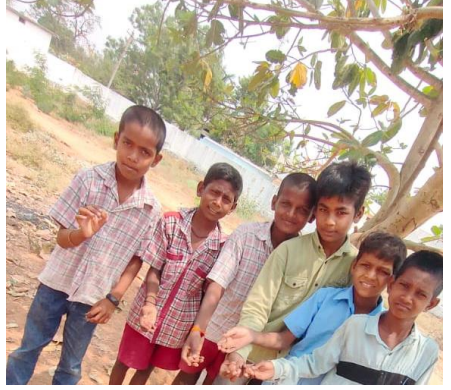
FIGS IN CLOSE OBSERVATION OF CHILDREN AT ZPHS KYATHANPALLY, NARAYANPET DISTRICT