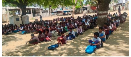
WATER DAY AT ZPHS DANTALAPALLY, MAHABUBABAD DISTRICT