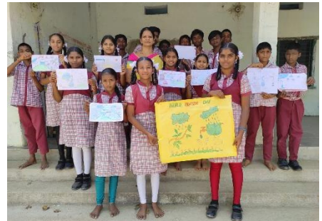
WORLD WATER DAY PLEDGE, ESSAY WRITING AND DRAWING COMPETITION AT ZPHS RAJULAKOTHAPALLY, NELLIKUDHURU MANDAL, MAHBUBABAD DISTRICT