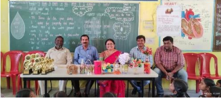
WATER DAY AT TSMS PALAMAKULA, RANGAREDDY DISTRICT