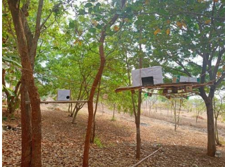
SPARROW BOXES AT MAHATMA GANDHI UNIVERSITY, NALGONDA

21/03/2024 | Mahabubabad | Page: 9