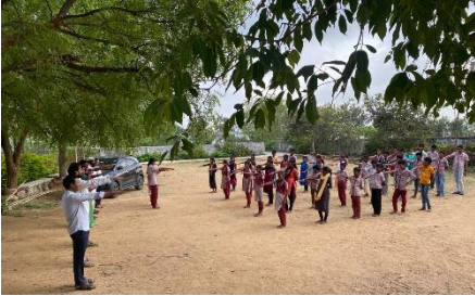
WATER DAY AT ZPHS MUNIGALAVEDU, MAHABUBABAD DISTRICT