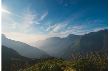
WESTERN GHATS, ONE OF THE UNESCO HERITAGE SITES IN INDIA

“Love the earth as you would love yourself.” –John Denver