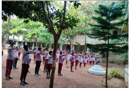
WATER DAY PLEDGE AT TSMS, GURTHUR, MAHABUBABAD DISTRICT