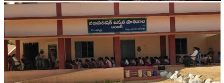
SAVE WATER COMPETITION AT ZPHS, ALOOR, MAHABUBNAGAR DISTRICT