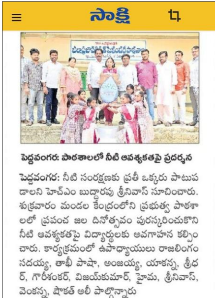
WATER DAY AT ZPHS PEDAVANGARA, MAHABUBABAD DISTRICT