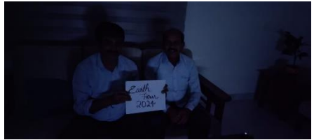
EARTH HOUR OBSERVED BETWEEN 8.30-9 30 PM ON 23 RD MARCH 2024 AT GDC SIDDIPIET