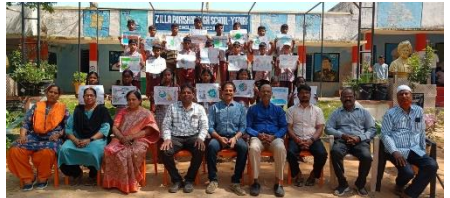
WATER DAY OBSERVED AT ZPHS YEDIRA, MAHABUBNAGAR DISTRICT