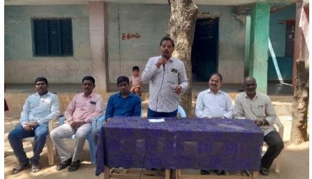
WATER DAY AT ZPHS AMANAGAL MAHABUBABAD DISTRICT