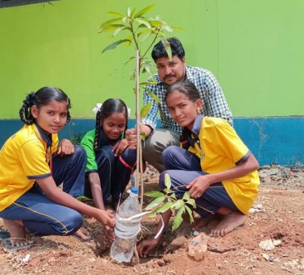
WATERING AND PLANT CARE AT ZPHS MEERKHANPET, RANGAREDDY DISTRICT