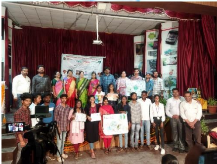
WATER DAY PROGRAMME IN GOVT. CITY COLLEGE (A) HYDERABAD