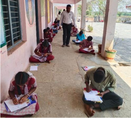
IN THE EVE OF WORLD WATER DAY DRAWING COMPETITION CONDUCTED IN ZPHS CHERLAPEM, THORRUR MANDAL, MAHABUBABAD DISTRICT