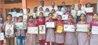
నీటి పాదుపుపై విద్యార్థులు గీసిన చిత్రలేఖనంతో ఉపాధ్యాయులు