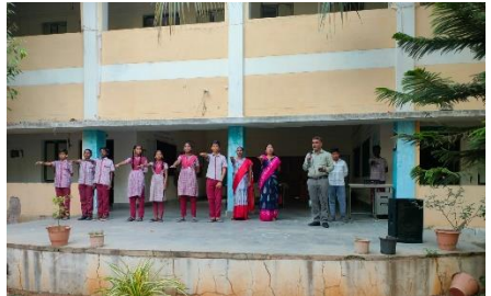
WATER DAY CELEBRATIONS AT TSWRDC VIKARABAD

Mar 22, 2024 9:00:02 AM 72/P Saraswathi College Road Yethbarpalle Telangana