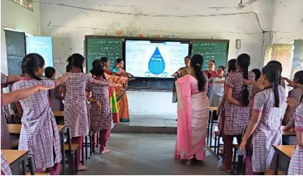
WORLD WATER DAY AWARENESS PROGRAMME IN ZPHS (G)GUDUR, MAHABUBABAD DISTRICT