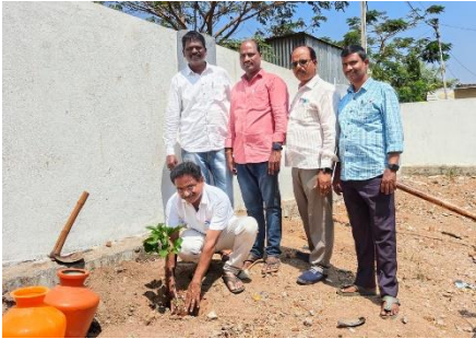
FOREST DAY AT ZPHS MUSHRIFA, NARAYANPET DISTRICT ON 21 MARCH 2024. THE STUDENTS ALSO COLLECTING SEEDS WITH AN AIM TO PREPARE ONE LAKH SEED BALLS FOR COMING MONSOON SEASON.