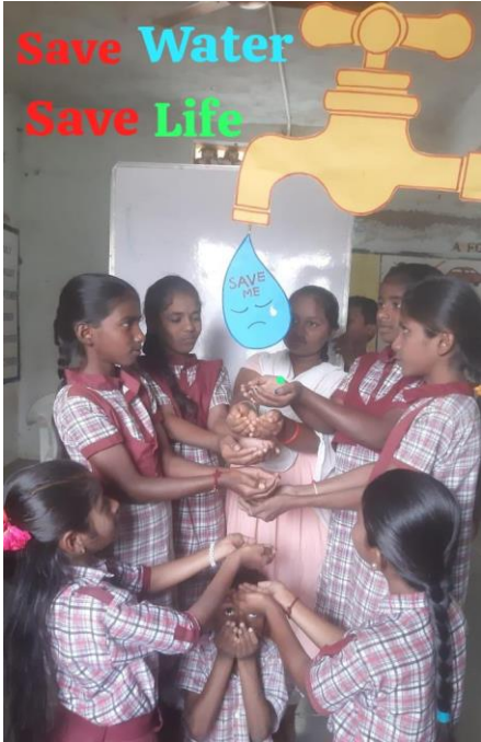
SAVE WATER-SAVE LIFE SKIT BY MPUPS BRAHMANAKOTHAPALLY, NELLIKUDURU MANDAL, MAHABUBABAD DISTRICT