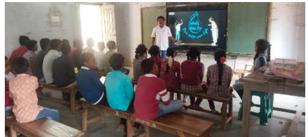
WATER DAY AT ZPHS, KAMBALAPALLY, MAHABUBABAD DISTRICT