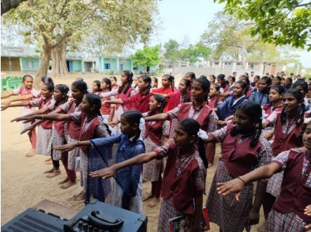
WATER DAY AT ZPHS KAMPALLY, MAHABUBABAD DISTRICT