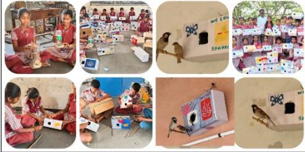
SPARROW DAY EARTH CLUB, MUSHRIFA, NARAYANPET DISTRICT ON THE OCCASION OF SPARROW DAY ON 20 TH MARCH 2024