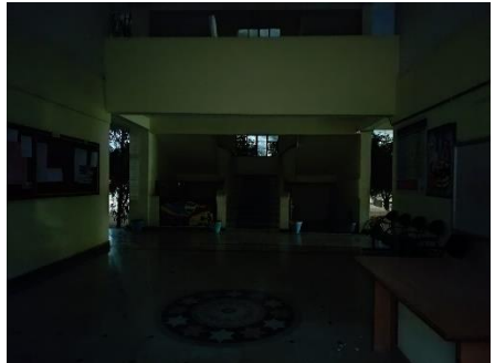
EARTH HOUR AT TSWRDC, VIKARABAD