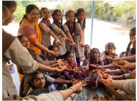
THE MAKING OF SEED BALLS AT TSMS PALAMAKULA, RANGAREDDY DISTRICT