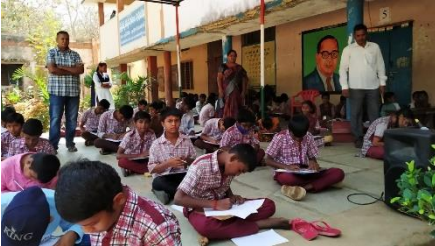
WATER DAY AT ZPHS SHASHABGUTTA, MAHABUBNAGAR DISTRICT