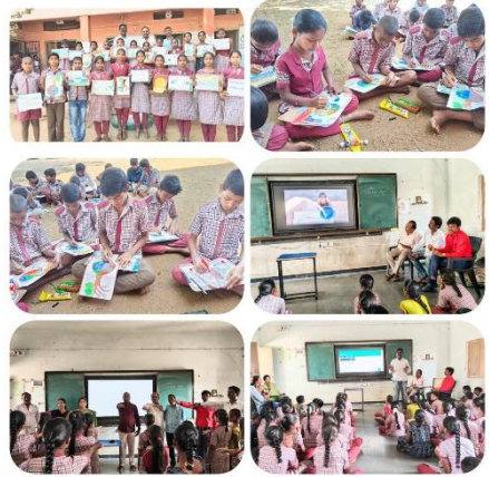
WATER DAY AT ZPHS MUSHRIFA, NARAYANPET DISTRICT